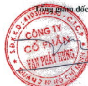
Trương Thành Nhân