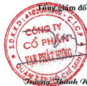
Trương Thành Nhân